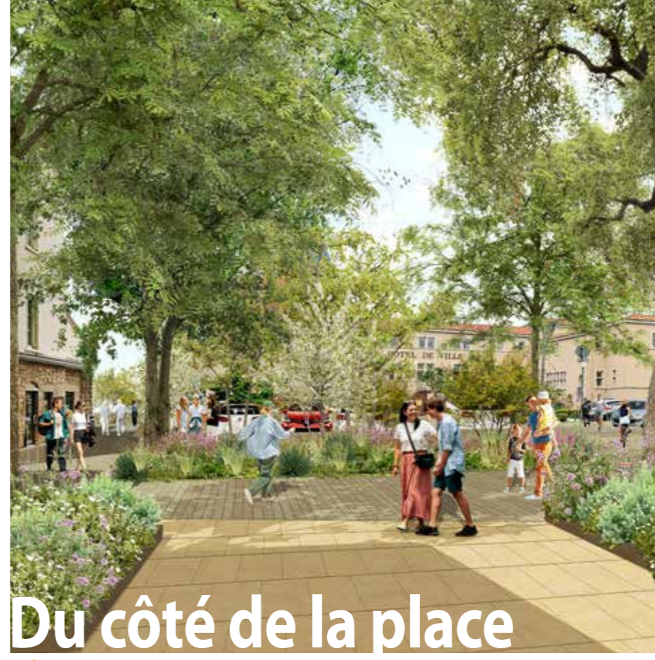
Vues non contractuelles